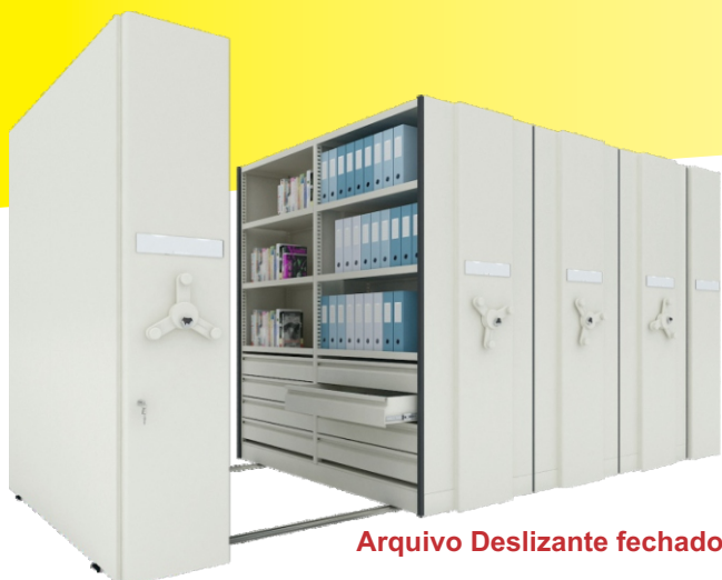
Arquivo Deslizante fechado