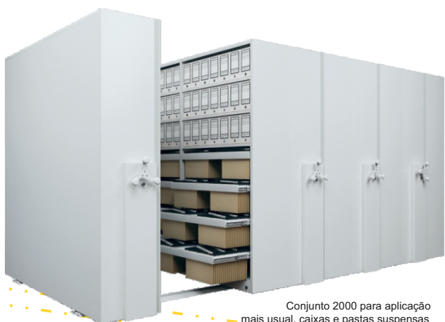
Conjunto 2000 para aplicação mais usual, caixas e pastas suspensas

uma nova fronteira em otimização de espaços