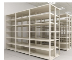
Estantes fixas com alto padrão de acabamento

Estrutura de montantes de aço, reforçado com componentes internos para todos os tipos de documentos e objetos, com regulagem em intervalos de 25 mm.